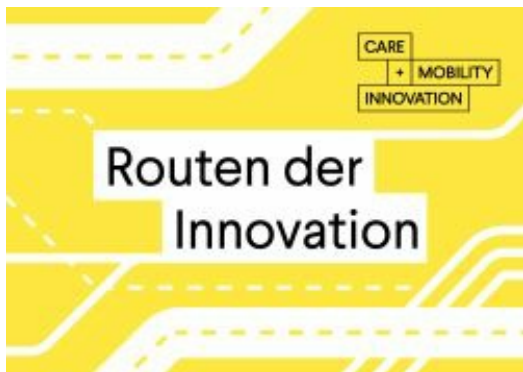
Routen der Innovation